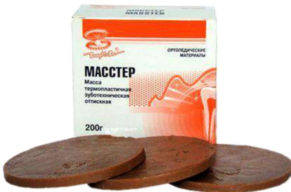
Рис. Термопластичная оттисковая масса Масстер (Владмива)