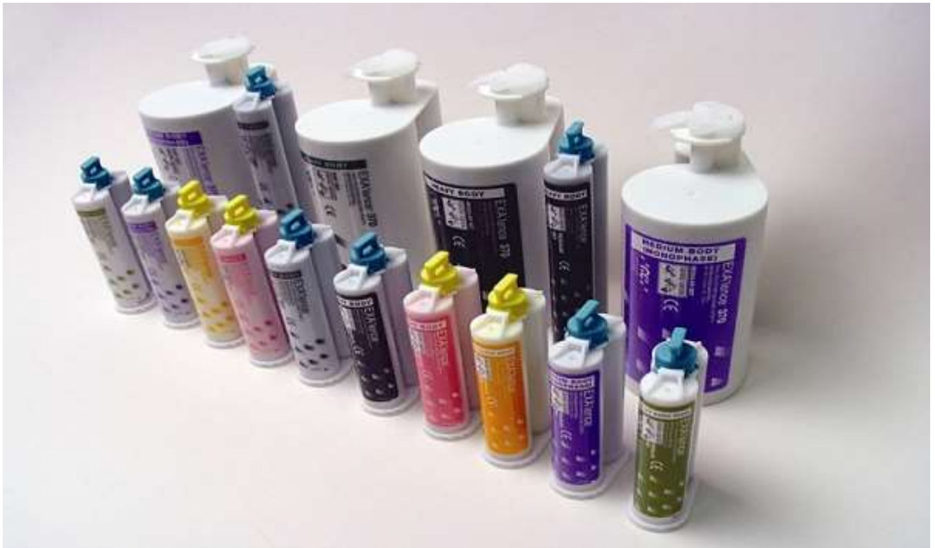
Рис. Винилполиэфирсиликоновая оттискная масса EXAlence (JC)

Тиоколовые (полисульфидные) оттискные материалы выпускаются в виде двух паст – тиоколовая паста, паста-ускоритель. По своим свойствам тиоколовые оттискные материалы приближаются к силиконовым, только термическая усадка тиоколовых материалов меньше. Температурный коэффициент линейного расширения в 2 раза меньше, чем у силиконовых. Повышение температуры и присутствие воды ускоряет процесс структурирования. Они в основном применяются для получения оттисков при изготовлении вкладок и коронок. Чаще всего применяется тиодент. Это эластичный слепочный материал (полисульфидный каучук). Применяется для получения точных оттисков, обладает высокой пластичностью, дает точное беззасадочное отображение рельефа слизистой оболочки и зубов. По своим свойствам приближается к сизласту. По одному слепку можно отлить несколько моделей.