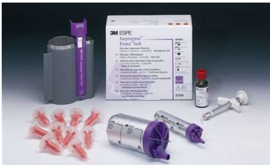
Рис. Полиэфирная оттисковая масса Impregnum Penta Soft (3M ESPE)

Отечественная промышленность полиэфирные оттисковые материалы не выпускает.