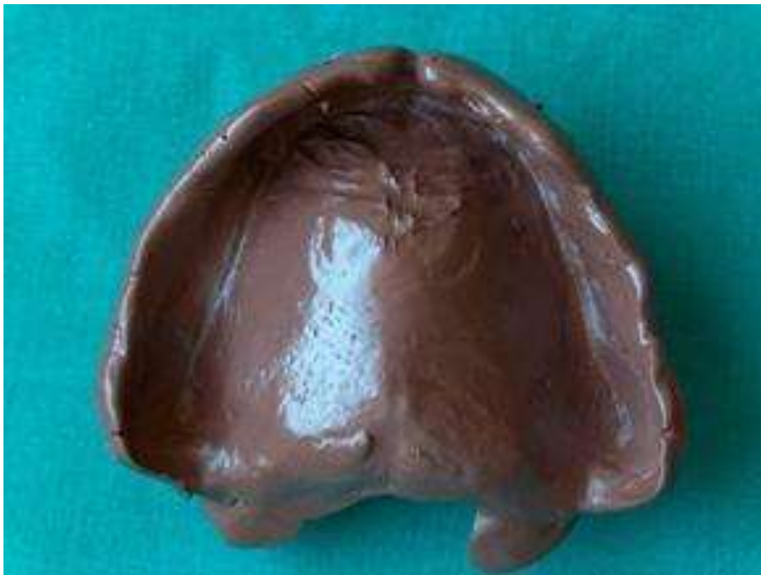
Рис. Функциональный оттиск полученный полусильфидной массой.