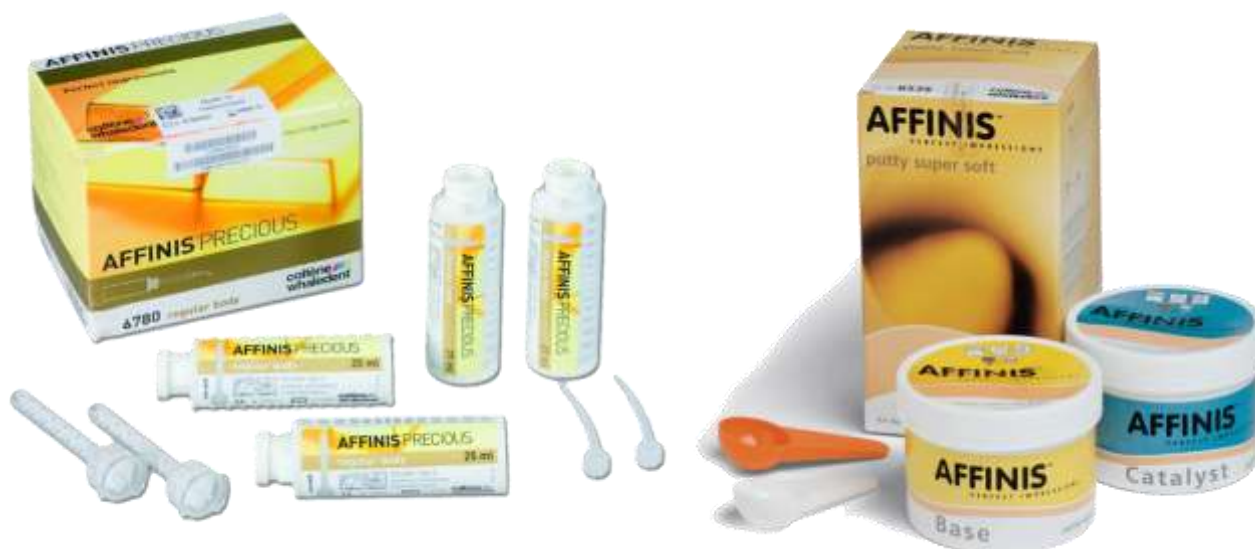
Рис. А-силиконовая оттискная масса Affinis (Colthene)

Полиэфирные оттискные материалы представлены в виде основной пасты и катализатора. Они могут быть высокой и низкой вязкости. Обладают тиксотропностью, т.е. под давлением становятся текучими, после устранения давления текучесть исчезает. В состав полиэфирных оттискных материалов входят полиэфир с высоким молекулярным весом, сульфоновая кислота, наполнитель (силикат), пластификатор и краситель. Реакция полимеризации проходит по типу полиприсоединения, т.е. без выделения побочных веществ. В связи с этим, отличаются очень небольшой линейной усадкой. Стабильны, однако, недостаточно пластичны. Пасты низкой вязкости используют для получения функциональных оттисков, при изготовлении вкладок, коронок, мостовидных протезов. Преимуществом является гидрофильность: хорошая текучесть, небольшая линейная усадка, точность отображения, хорошие рабочие качества. Недостатками являются: недостаточная эластичность, небольшое сопротивление разрыву, набухание во влажной