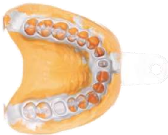
Рис. Двухслойный рабочий оттиск верхней челюсти из А-силикона

Оттискные материалы применяются в стоматологии для точного негативного отображения тканей полости рта (протезного ложа), что позволяет в реальные сроки изготовить модель без искажений.